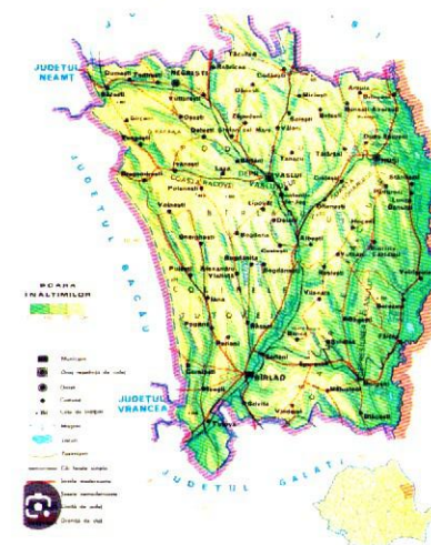
Harta Județului Vaslui (U.A.T. Găgești)

Din punct de vedere etnografic, am putea spune, fără teama de a greși, așezarea face parte dintr-o categorie social-teritorială cu un trecut istoric mai aparte. Viața de zi cu zi a sătenilor a fost