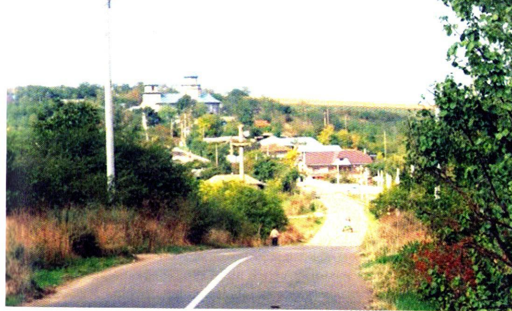
Intrarea în satul Tupilați, dinspre Murgeni (2023)

În vechime și acesta era sat de răzeși, fiind atestat documentar încă de la 1 iunie 1672 9 . Șoseaua, astăzi asfaltată, străbate cam un kilometru din satul Tupilați. La nici 2 km se află satul Poșta Elan, ce aparține astăzi de comuna Vutcani. În vechime a făcut parte din comuna Mălăești, împreună cu satul Tupilați. Așezarea Poșta Elanului este atestată documentar încă din anul 1812. La Poșta Elan erau pe timpuri schimbați caii la căruțele poștașilor 10 . Drumul județean 244 B își continuă apoi traseul pe Valea Elanului, trecând și pe lângă lacul de acumulare Poșta Elan, și lasă pe stânga, în zare, satul Mălăești, fostă reședință de comună, de care a aparținut și satul Tupilați, atestat documentar încă din 1611 11 . Șoseaua continuă de aici aproximativ 30 km, până la Crețești, de unde există posibilitatea de a ajunge la Huși sau la Vaslui. Trecând prin comuna Dimitrie Cantemir, aceasta intersectează la un moment dat și D.J. 244 C, drum de pe care se poate ajunge tot la Huși.