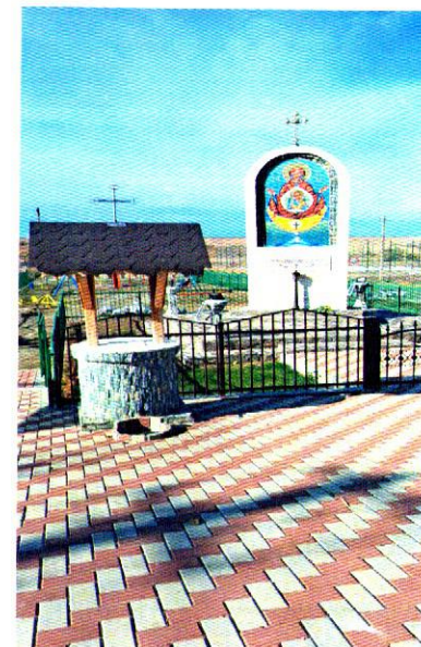
Troița din satul Peicani – 2022

Din centrul satului Găgești, călătorul poate fie să meargă mai departe pe D.J. 244 B, fie să facă la stânga pe D.J. 244 H.