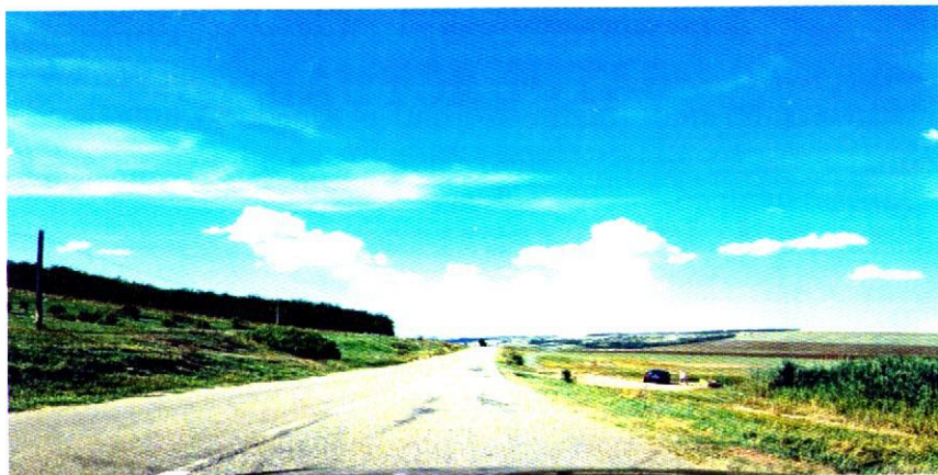
Drumul D.J. 244 B, pe Valea Elanului, în punctul denumit „Argeaua”

vetre getice. Iarna, priveliștea este mult mai impresionantă, când zăpada colorează în argintiu toata zona”. 1